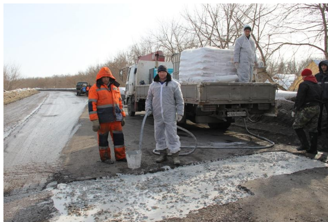
В Уфе начали применять гипсобетонные смеси для ямочного ремонта